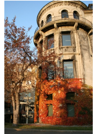
Bibliothèque de l'Université McGill Bibliothèque Schulich – Sciences et ingénierie

L'ABRC a entrepris la première enquête pour évaluer les perceptions des membres d'un corps professoral par rapport aux services qu'offrent les bibliothèques universitaires au Canada. Les résultats seront disponibles au printemps 2015.