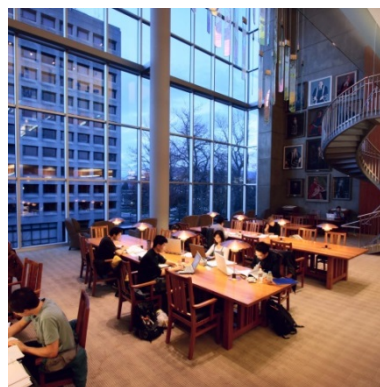
University of British Columbia, Irving K. Barber Learning Centre, salle Ridington

Source : Statistiques de l'ABRC pour 2012-2013