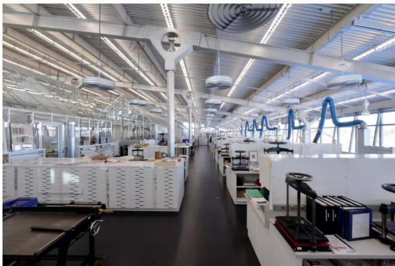
Laboratoire de conservation des livres du Centre de préservation de Bibliothèque et Archives Canada au 625, boulevard du Carrefour, Gatineau, Québec, Canada Architectes : Blouin, IKOY & associés (architecte en chef – Ron Keenberg)