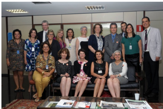
Participants à la Tournée d'étude en compagnie de quelques hôtes brésiliens

Tournée d'étude au Brésil. Pendant dix jours, la délégation a visité 20 établissements (dont huit universités) à São Paulo, à Rio de Janeiro et à Brasília.