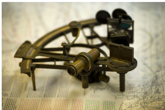
Sextant provenant de la collection de la Bibliothèque Dr C. R. Barrett de la Memorial University.