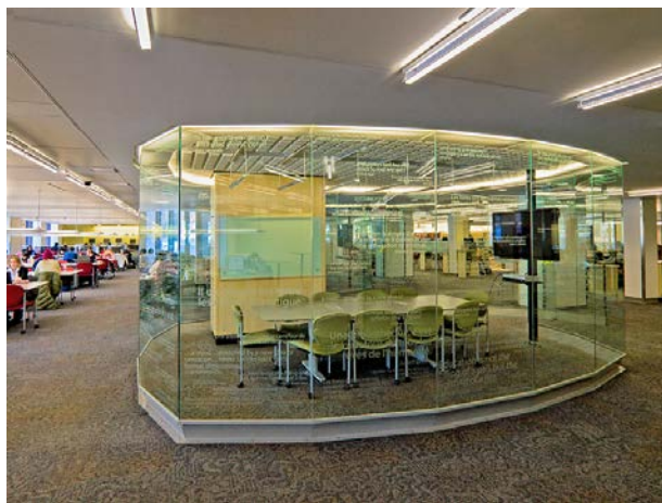
McGill Redpath Library Cyberthèque