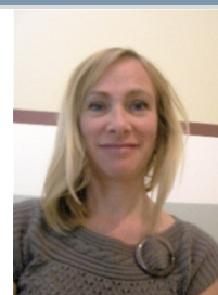
Données de recherche