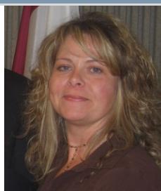
Bibliothèques de recherche